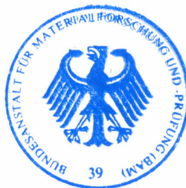
Dipl.- Ing. B.-U. Wienecke

Arbeitsgruppe Zulassung und Verwendung Im Auftrag / For